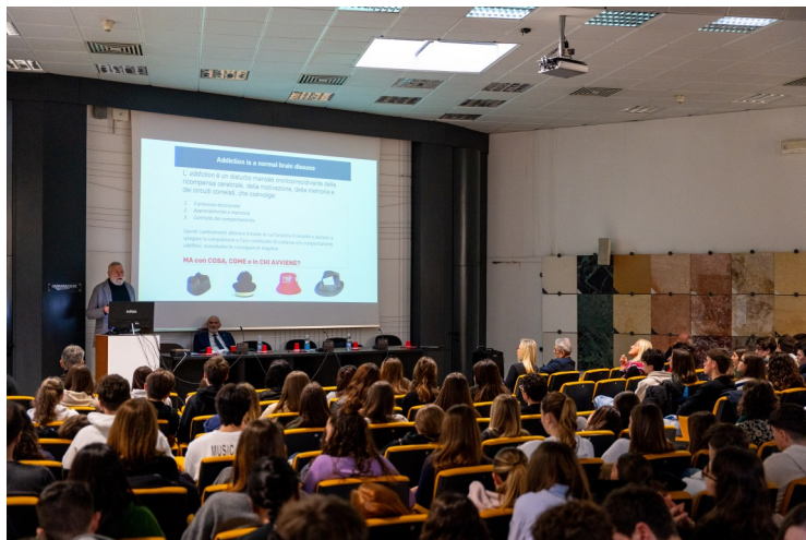
La Sala Marmoteca gremita

Il 15 marzo 2025, presso la Sala Conferenze Nausicaa di Marina di Carrara, si è svolto il convegno “ Liberamente – Uso, abuso e dipendenza da sostanze ”, promosso dall’OMCeO Massa Carrara con il coinvolgimento dell’Azienda Ospedaliera Universitaria Integrata di Verona, del CLAD – Centro Lotta alle Dipendenze, del Liceo Scientifico “Fermi” e del Liceo Classico “Repetti” di Massa.