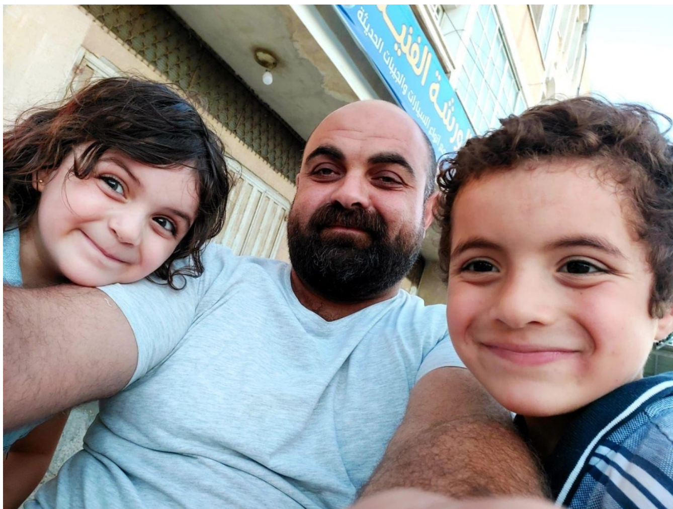
Il marito della dr.ssa Al-Najjar con due dei suoi 10 figli

“Ci associamo anche noi all’appello del Direttore Generale dell’Organizzazione Mondiale della Sanità Tedros Adhanom perché si abbia pietà di un popolo così drammaticamente martoriato. Alle bombe si aggiunge la fame e alla mancanza di cibo si aggiunge la carenza di farmaci e presidi sanitari per la cura dei tantissimi malati. Ci preoccupa la sicurezza dei medici e del personale sanitario italiano e europeo che opera con grandissima difficoltà e con eroismo a Gaza.”